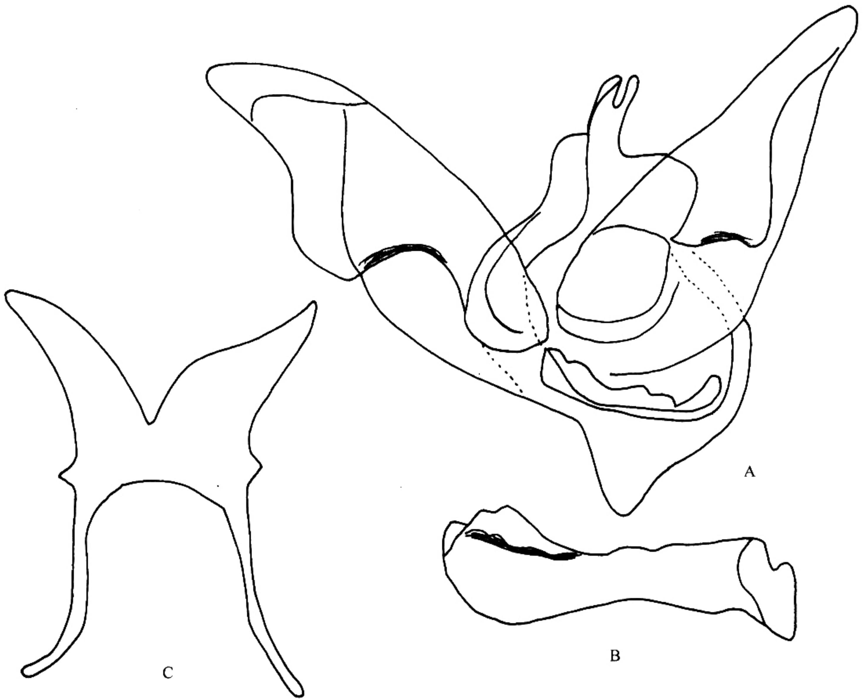
图 25 象银斑舟蛾 Tarsolepis elephantorum Bänziger 的外生殖器

Tarsolepis elephantorum Bänziger, 1988, Nat. Hist. Bull. Siam Soc. 36 : 19.